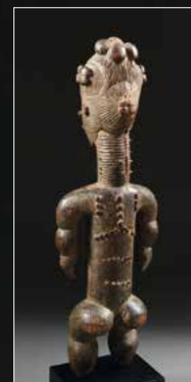
Representación de antepasado femenino. Cultura attie. Región de Los Lagos. Costa de Marfil. Transición ss. XIX-XX. Madera con pátina de uso. 37,5 cm. Antigua colección privada. París. Antigua colección Antoine Ferrari de la Salle. Abidjan.