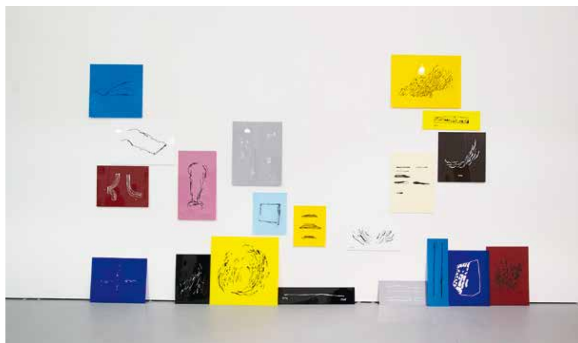
Stand de la galería Max Estrella de la última edición de la feria Untitled Art de Miami.

Dos semanas después de las subastas de Nueva York, el 30 de noviembre inauguraba la décima quinta edición de ART BASEL MIAMI BEACH . Con un listado de 269 galerías procedentes de 29 países y distribuidos en cinco secciones, la que probablemente es la segunda feria más importante del año testaba el ánimo del mercado tras los resultados electorales en Estados Unidos. La magnitud de la actividad que genera la feria es realmente significativa y a modo de Terraforming , la transformación que ha experimentado Miami ha hecho que pasara de tener 6 galerías en 2002 a alrededor de 130 en 2016. Igualmente es destacable el millón de visitantes que recibe la ciudad gracias a la feria, sobre los 14 millones de turistas que totaliza durante el año. Alrededor de semejante coloso queda hueco para otros actores que ofrecen propuestas de gran calidad más allá del Olimpo de Basel, así por ejemplo las ferias NADA o UNTITLED presentan propuestas con artistas de excelente trayectoria y en un rango de precios cercano a los 15.000 euros. Especialmente en esta última, la presencia de galerías españolas tuvo un cartel excepcional. ADN, ALARCÓN CRIADO, ESPACIO MÍNIMO, MAX ESTRELLA, y NF dieron voz a la escena contemporánea española. En el caso de Max Estrella, fue su tercera participación y presentó obra de los artistas españoles ALMUDENA LOBERA y LUIS ÚRCULO , así como la magnífica serie Becher de MARLON AZAMBUJA .