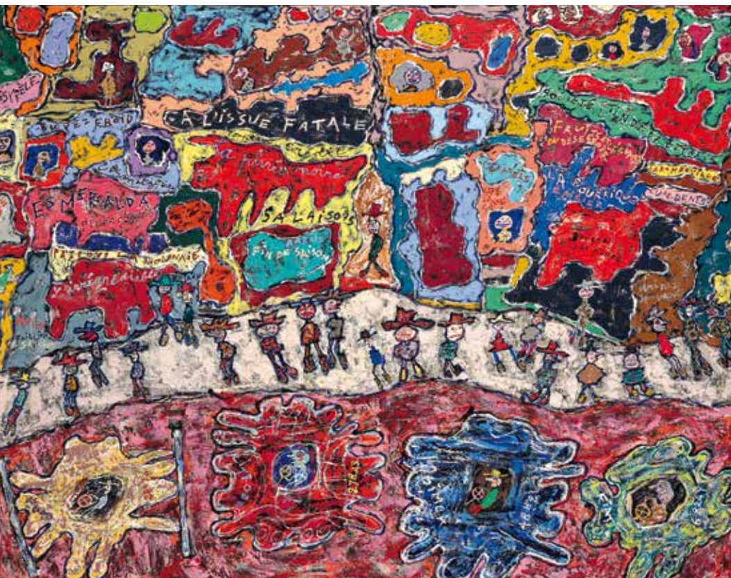
Jean Dubuffet Las grandes arterias 1961 Óleo sobre lienzo 113,7 x 146cm

evolución similar hemos visto en el valor de referencia por excelencia: Warhol; que ha pasado de tener una sobre exposición en las subastas a una significativa reducción en el suministro de obra. Esta circunstancia queda reflejada en la gráfica de evolución del total de ventas en 2016, que se mueve en torno a los 100 millones y sigue una drástica caída igual que Richter. Podríamos interpretar que la considerable presencia de Richter en la subasta de Sotheby's responde a coleccionistas deshaciendo posiciones del 2010 con una elevada rentabilidad, y a su vez, otros con interés en la compra por la perspectiva de mejora en 2017.